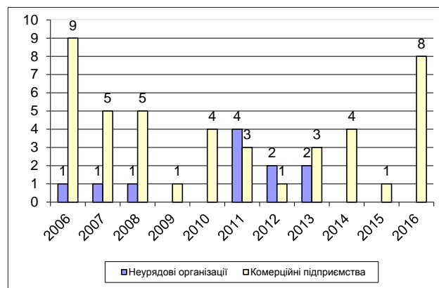
Рис. 2. Розподіл діючих членів Глобального договору ООН України за часом їх приєднання до цієї ініціативи

Сьогодні учасниками мережі Глобального Договору ООН в Україні залишаються лише 55 компаній, з яких 11 – це неурядові організації, 44 – комерційні підприємства. На рисунку 2 [9] подано розподіл діючих членів Глобального договору ООН України за часом їх приєднання до цієї ініціативи.