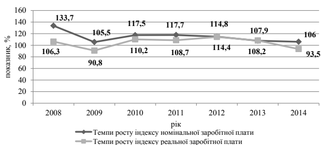
Рис. 2. Темпи зростання індексів номінальної та реальної заробітної плати в Україні за 2008–2014 рр., %

вважається та сума грошей, що отримує працівник за час своєї роботи, виконані послуги; а реальною – скільки працівник може витратити, тобто що він зможе купити за отриману номінальну заробітну плату. Порівняємо темпи росту номінальної та реальної заробітної плати (рис. 2).