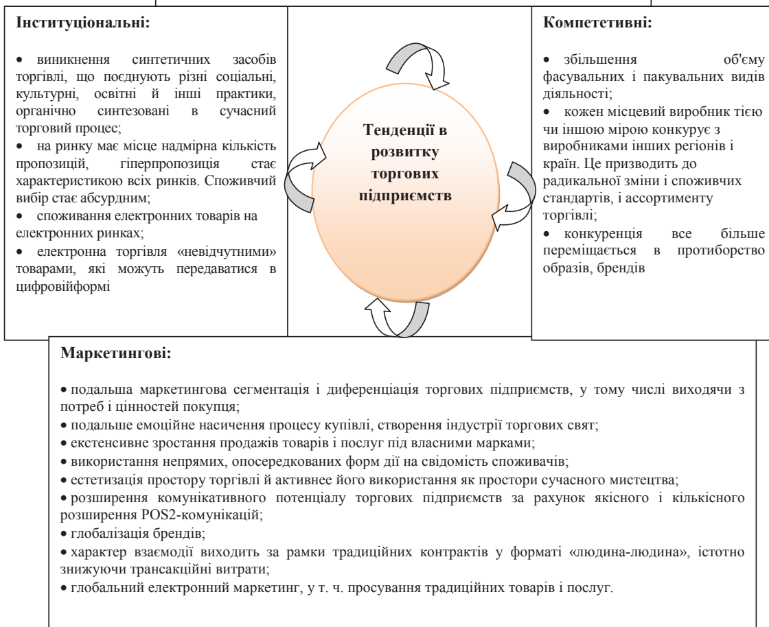
Рис. 2. Тенденції в розвитку торгових підприємств [2, с. 34; 3, с. 70; 6]