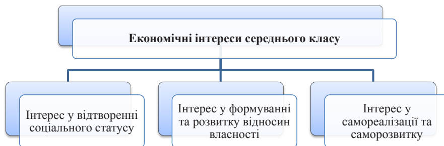
Рис. 2. Економічні інтереси середнього класу

Інтереси середнього класу подібні до інтересів більшості населення, проте їх специфіка полягає в тому, що середній клас потребує стабільного розвитку економіки та соціуму, оскільки йому є що втрачати. Прагнення до