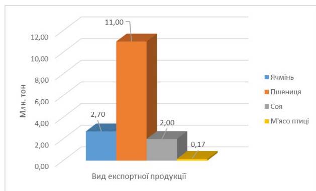
Рис. 2. Основні експортні показники АПК станом на вересень 2016 року [2]

Ключові показники позитивного зростання ефективності діяльності підприємств АПК в напрямі експортних поставок наведено в інфографіці (рис. 2).