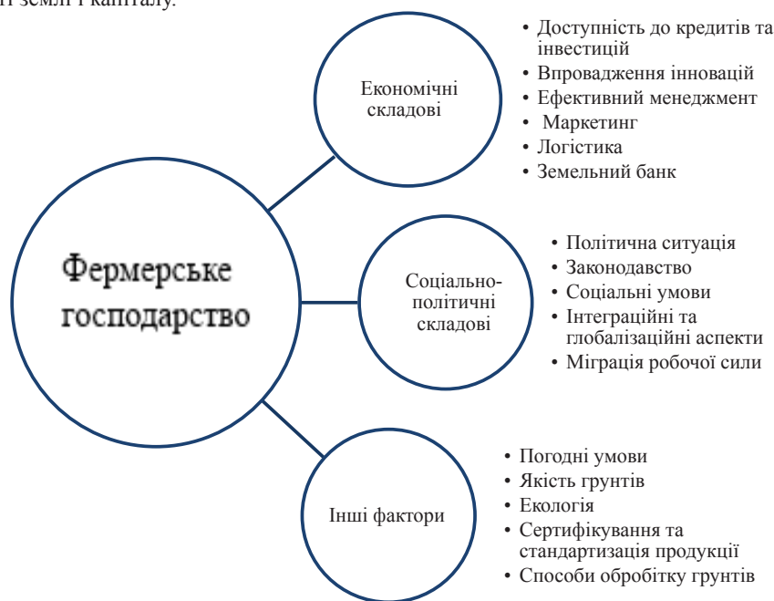
Рис. 1. Вплив основних факторів Форсайту на ефективне функціонування фермерських господарств Хмельницької області*