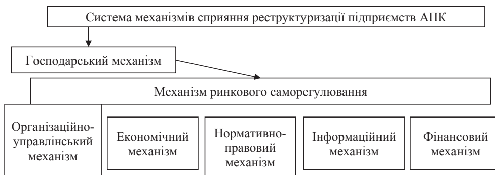
Рис. 1. Система механізмів реструктуризації аграрних підприємств

двох основних способах реалізації дії економічних законів: а) через ринковий стихійний механізм; б) через свідоме і планомірне створення сприятливих умов для використання прогресивних тенденцій у дії цих законів. Зважаючи на сутність господарського механізму як форми реалізації дії економіч-