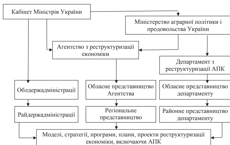
Рис. 5. Загальнодержавна структура управління процесами реструктуризації економіки

імпорт продовольчих товарів; про кооперативний рух в сільській місцевості тощо. Сумарна інформація за цими та іншими показниками повинна концентруватися у відповідних статистичних органах.