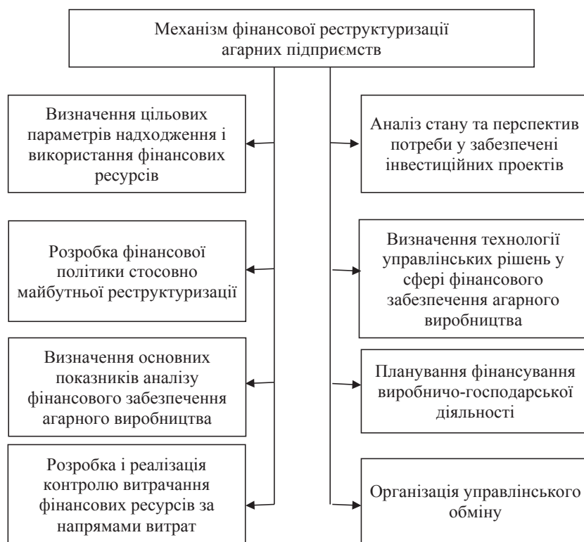
Рис. 4. Структура та зміст фінансового механізму реструктуризації аграрних підприємств

Водночас широкого розповсюдження в аграрних формуваннях набула комерційна інформація, покликана не стільки бажанням політики менеджменту, скільки прагненням приховати інформацію про реальний стан справ з метою мінімізації податків, що сплачуються. Фактично інформація про рух фінансових і товарних потоків в аграрних підприємствах є недостатньою як для органів управління усіх ієрархічних рівнів, так і для наукових досліджень з аграрної проблематики. На практиці це виявляється у формуванні особливої інформаційної бази, спрямованої на збереження комерційної таємниці, збереження тіньових схем господарювання, які вимірюються за допомогою особливих методів і не піддаються виміру за однорідними показниками. Удосконалення інформаційного забезпечення реструктуризації підприємств АПК на перспективу вбачається в безумовній акумуляції масивів даних господарської діяльності за такими напрямками: про стан розвитку аграрної економіки загалом; про результати господарської діяльності галузей, підприємств і виробництв АПК за напрямками спеціалізації; про забезпечення асортиментом продовольчої продукції власного виробництва в регіональному розрізі; про міжрегіональні поставки продовольства в рамках функціонування спільного аграрного ринку; про експорт та