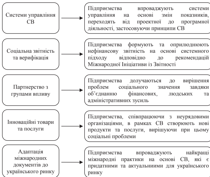
Рис. 1. Прояви соціальної відповідальності в Україні через інструментарій

Щодо результатів опитування на ТОВ «Очаківський райагрохім» Очаківського району Миколаївської області,