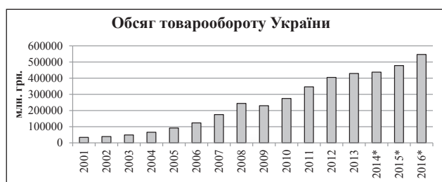
Рис. 1. Обсяг роздрібного товарообороту України

З 2001-го по 2016-й рр. в Україні збільшувались темпи зростання обсягів роздрібного товарообігу підприємств (рис. 1), проте варто відзначити, що економічна ситуація в країні, зниження купівельної спроможності населення тощо скорочують цей показник в товарному еквіваленті порівняно з докризовим періодом.