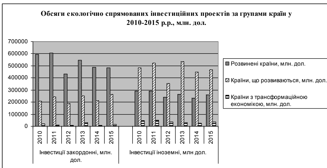
Рис. 2. Обсяги екологічно спрямованих інвестиційних проектів за групами країн у 2010–2015 рр.