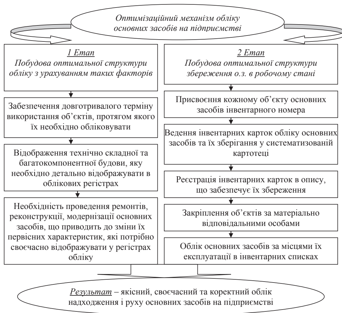
Рис. 1. Розроблений оптимізаційний механізм управління обліком основних засобів

1) Додержання стратегічних цілей економічного розвитку підприємства в контексті забезпечення ефективності використання основних засобів, який повинен створювати необхідні матеріальні та фінансові умови для реалізації цілей і завдань економічного розвитку підприємства загалом.