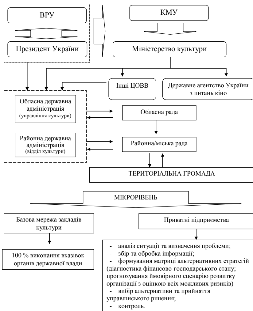
Рис. 2. Схема організаційного забезпечення реалізації управлінського рішення

З метою оцінки ефективності реалізації стратегічних заходів культурної політики, спрямованих на формування умов для залучення в галузь додаткових позабюджетних фінансових ресурсів, доцільним є використання таких