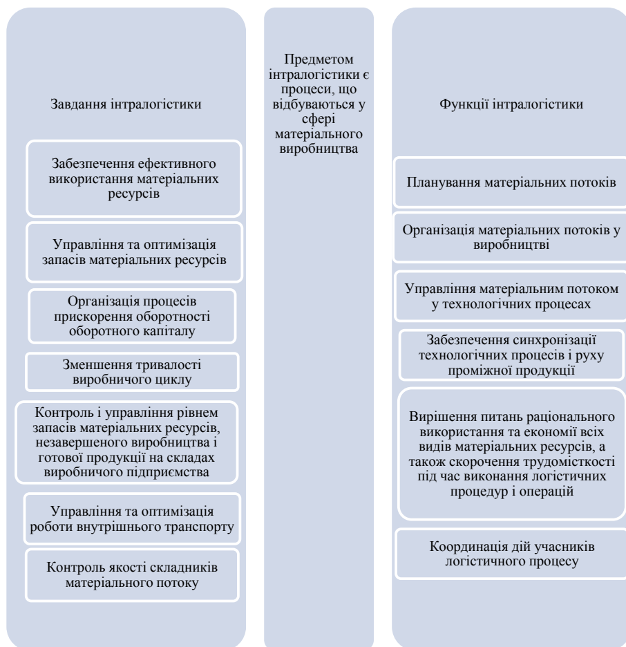
Рис. 1. Основні функції та завдання інтралогістики (власна розробка)

Функціональний цикл інтралогістики – це сукупність взаємопов'язаних і взаємозалежних процесів, що утворюють у цьому часовому періоді закін-