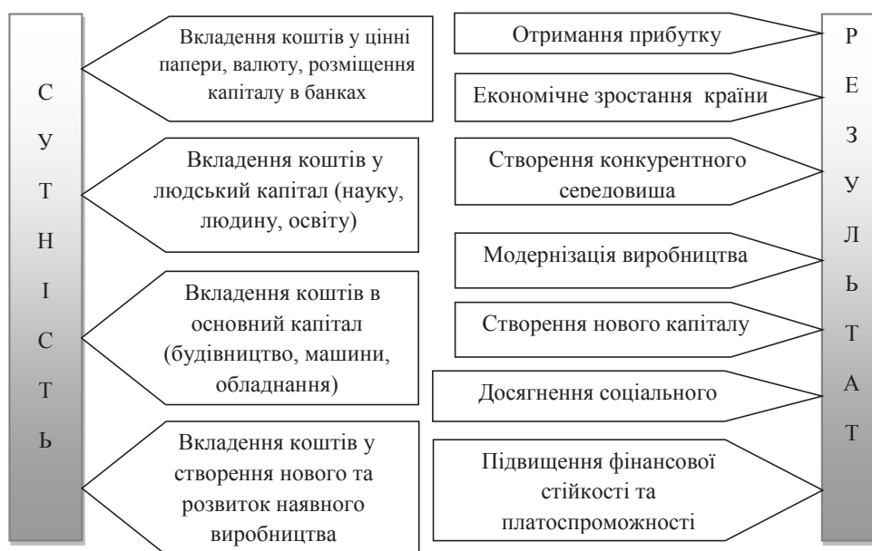
Рис. 1. Сутність інвестицій і результати їх вкладення

Існує чотири види джерел інвестування: приватне, державне, іноземне та спільне. Приватне інвестування здійснюють громадяни, суб'єкти підприємництва недержавної форми власності, господарські асоціації, спілки, товариства, громадські та релігійні організації. Державне інвестування здійснюють органи центральної і місцевої влади та управління, державні підприємства, різноманітні державні фонди. Іноземне інвестування здійснюють підприємства, що створені іноземними громадянами, юридичними особами, державами. Спільне інвестування здійснюють громадяни й юридичні особи України та іноземних держав.