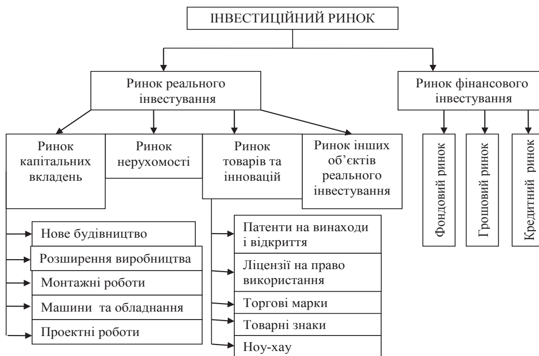
Рис. 2. Структура інвестиційного ринку

У системі ефективного розвитку національної економіки досить важливу і чи не найголовнішу роль виконує інвестиційний ринок (рис. 2), який являє собою «сукупність економічних відносин, що виникають між продавцями й покупцями інвестиційних товарів і послуг, а також об'єктів інвестування в усіх його формах» [4, с. 396].