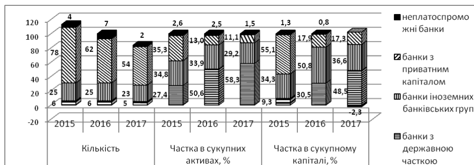
Рис. 1. Динаміка інституційної структури банківського сектору України у 2015–2017 рр.

По-перше, вона відображає роль банківської системи як фундаменту для розвитку інших секторів економіки в межах державної економічної політики. Так, державні банки України займають лідируючі позиції на ринку банківських депозитів фізичних осіб і на ринку банківських кредитів юридичних осіб, що сприяє досягненню стратегічних економічних цілей. Так, «Укресімбанк» перш за все орієнтований на обслуговування зовнішньоторговельної діяльності держави. Крім того, виступаючи фінансовим агентом Кабінету Міністрів України, він супроводжує зовнішні та внутрішні кредити, надані під гарантію держави. «Укргазбанк» є уповноваженим банком щодо здійснення розрахунків за митними платежами. «Ощадбанк», який є правонаступником Ощадбанку УРСР, основною функцією якого було акумулювання заощаджень населення, виконує певні соціальні функції [6, с. 189].