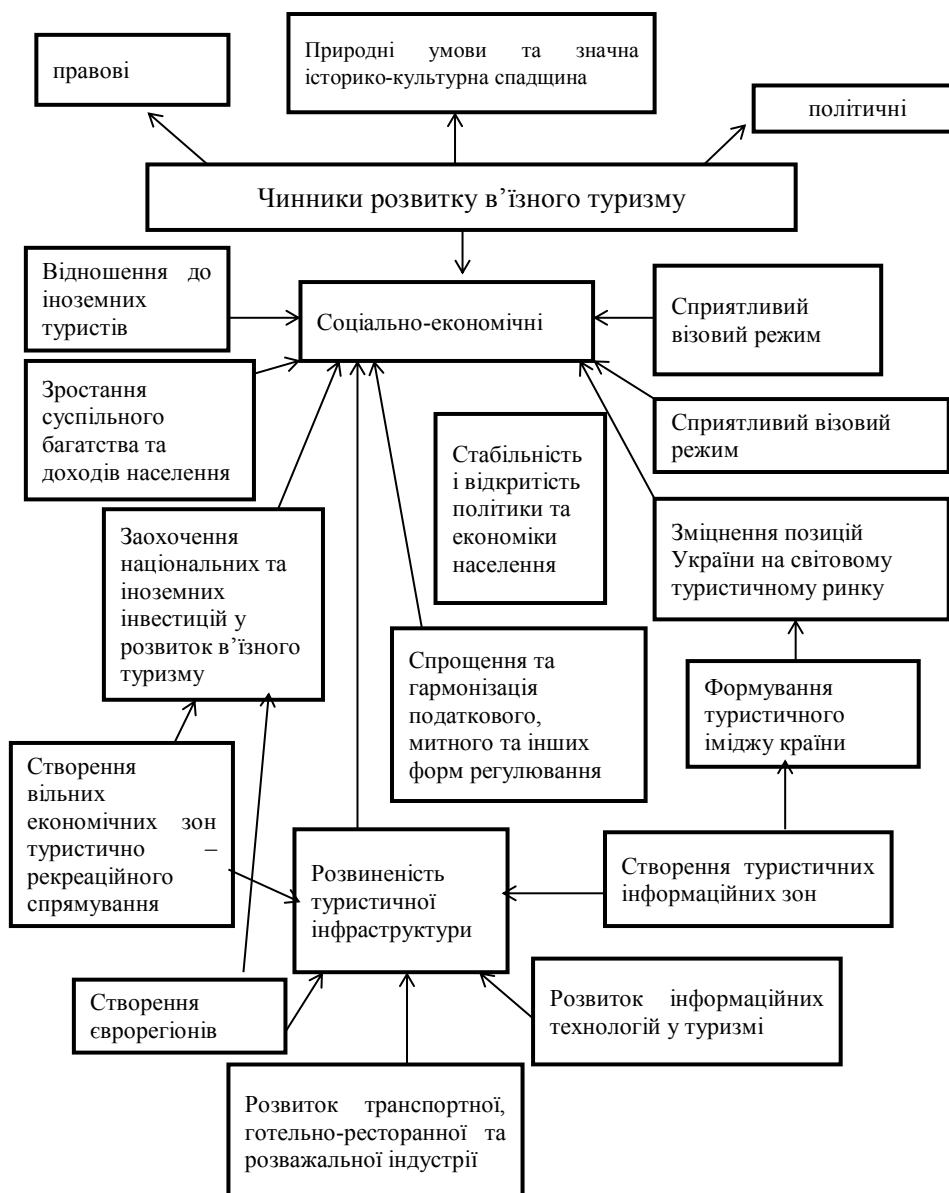
Рис. 2. Чинники розвитку в'їзного туризму [15]

а) прямих інвестицій у формування туристичної індустрії;