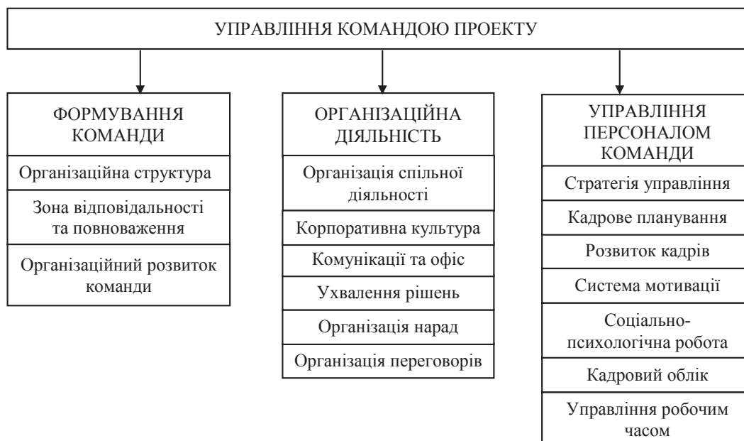
Рис. 1. Структура системи управління командою проекту