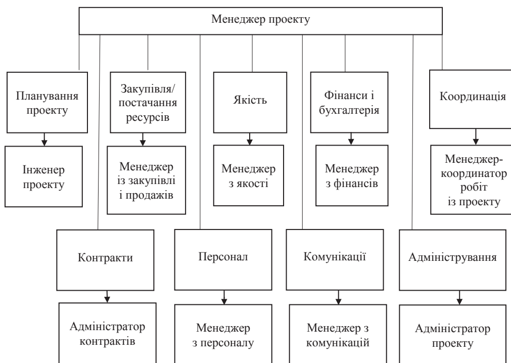
Рис. 2. Приблизний склад команди проекту

проектом; психологічну сумісність членів команди і створення активної стимулюючої культури; розгорнуте спілкування і виготовлення оптимальних групових рішень проблем, які виникають під час реалізації проекту.