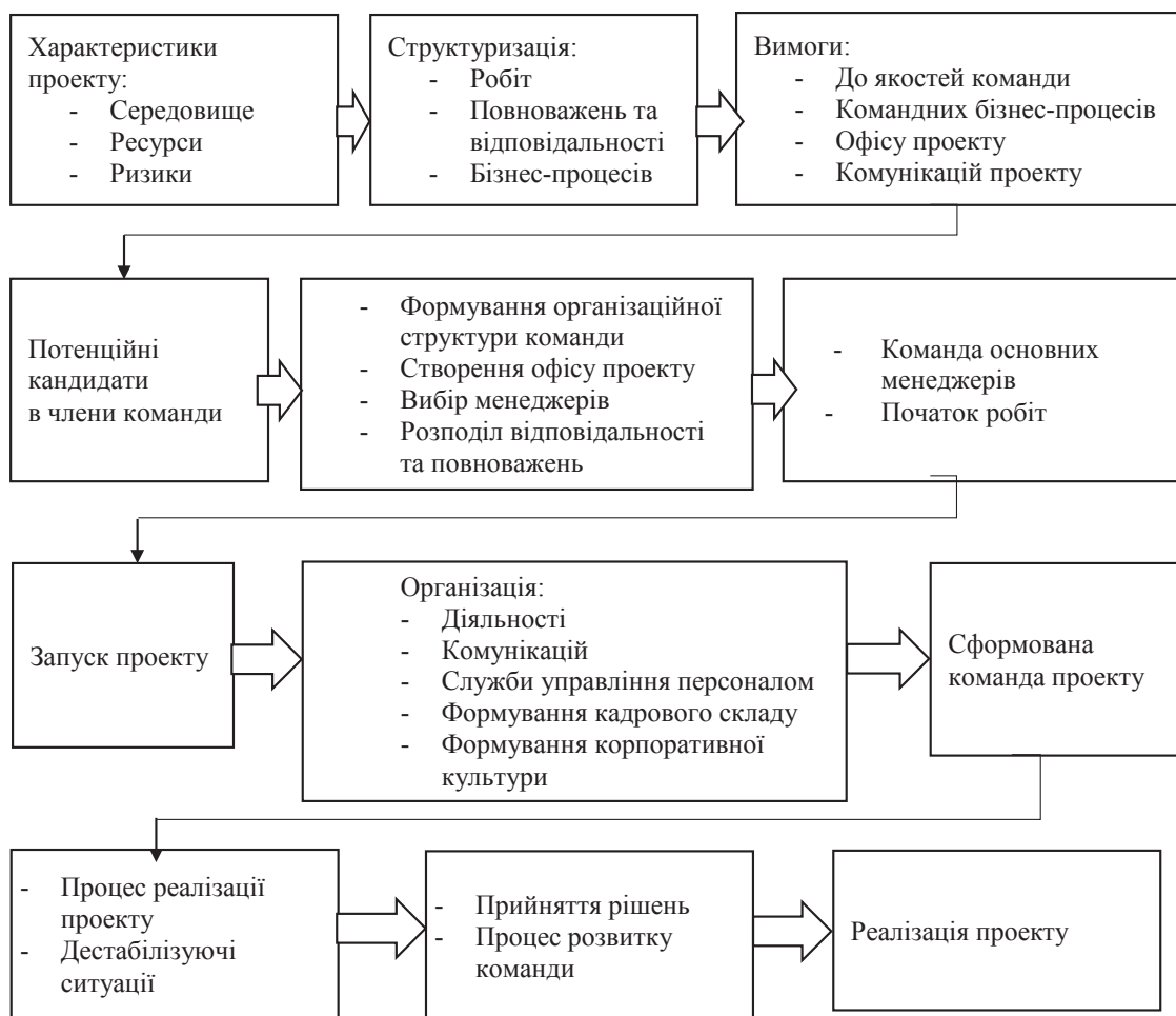
Рис. 3. Модель формування ефективної команди проекту