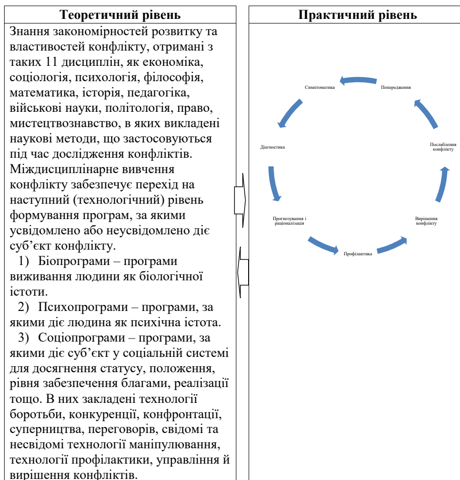
Рис. 3. Взаємозв'язок теоретичного та практичного рівнів діагностики конфліктів під час вирішення питання їх трансформації

Соціально-позитивний конфлікт є можливим тоді, коли конфліктуючі сторони усвідомлюють відповідальність за його наслідки. Це стає конструктивом і сприяє вирішенню проблем і протиріч, а також переходу людини, організації, суспільства, держави на новий рівень розвитку. Такий перехід на новий рівень відносин є можливим за досягнення феномена цілісності, що стає соціальним феноменом. Щодо функціональної взаємодії елементів у цілісності, то її можна відслідкувати з використанням діагностики конфлікту, що нерозривно пов'язана з аналізом та синтезом. Введення цього поняття ставить перед дослідниками завдання виокремлення цілісності конфлікту та методів його дослідження. Ця цілісність не може належати жодній науковій дисципліні, що займається дослідженням конфліктів. Більш того, з огляду на певну практичну задачу на перший план можуть виходити функції або характеристики, які за іншої постановки завдання не мали істотного значення.