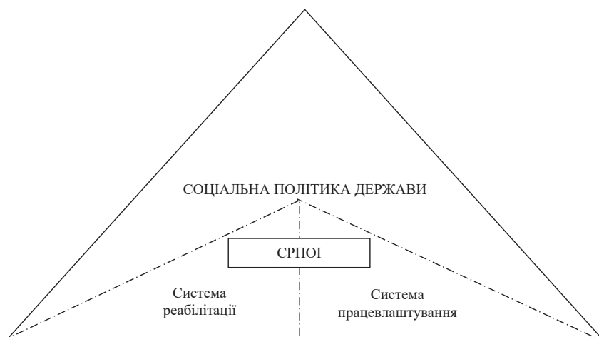
Рис. 1. СРПОІ як підсистема соціальної політики держави