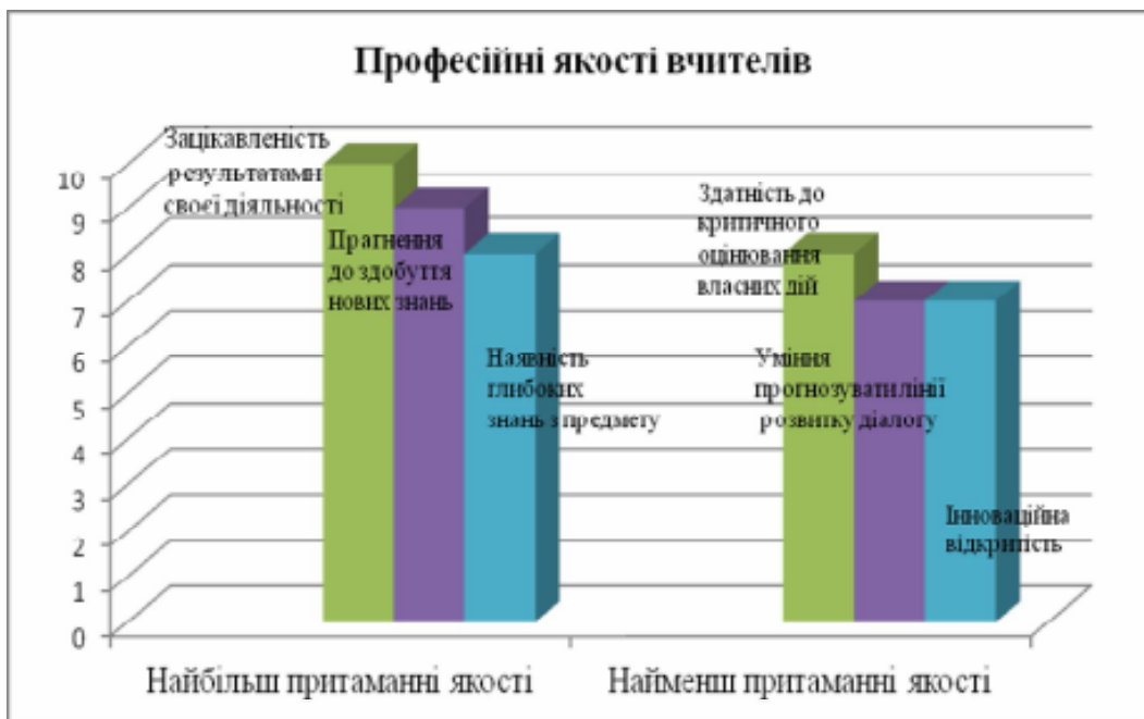
Рис. 2. Результати дослідження професійних якостей вчителів початкових класів

Такі професійні якості сучасних вчителів, як зацікавленість результатами своєї діяльності, прагнення до здобуття нових знань, наявність глибоких знань з предмету свідчать про знання історичних та концептуальних засад навчального співробітництва, технологій його реалізації. Інноваційна відкритість, уміння прогнозувати лінії розвитку діалогу, здатність до критичного оцінювання власних дій свідчать про рівень готовності вчителів до нововведень, мистецтво управління педагогічною взаємодією (рис. 2).