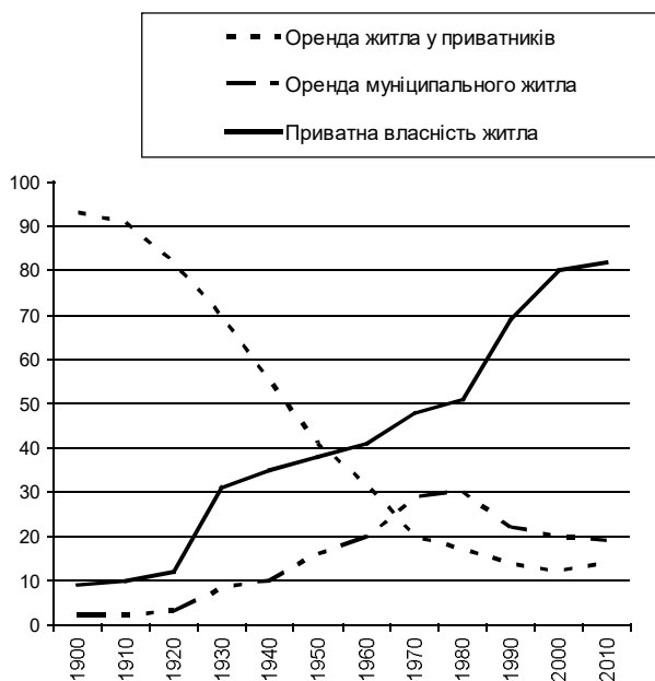
Рис. 1. Основні типи проживання у Великій Британії

У 80-ті роки консервативний уряд М.Тетчер провів безпрецедентну кампанію з дискредитації усієї системи державної благодійності, а особливо по відношенню до соціальної роботи.