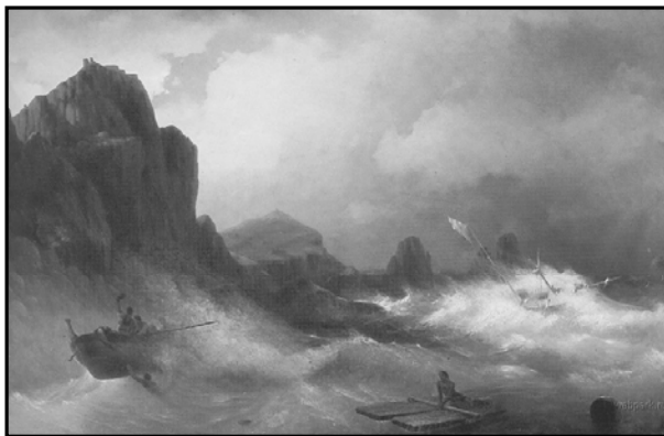
Рис. 3. Репродукція картини І.К. Айвазовського «Аварія корабля» (1843)

Під час вивчення оптичних явищ можна приділити увагу тому факту, що місто на задньому плані освітлене, а від дерева падає тінь, і люди поблизу нього зображені в напівтіні.