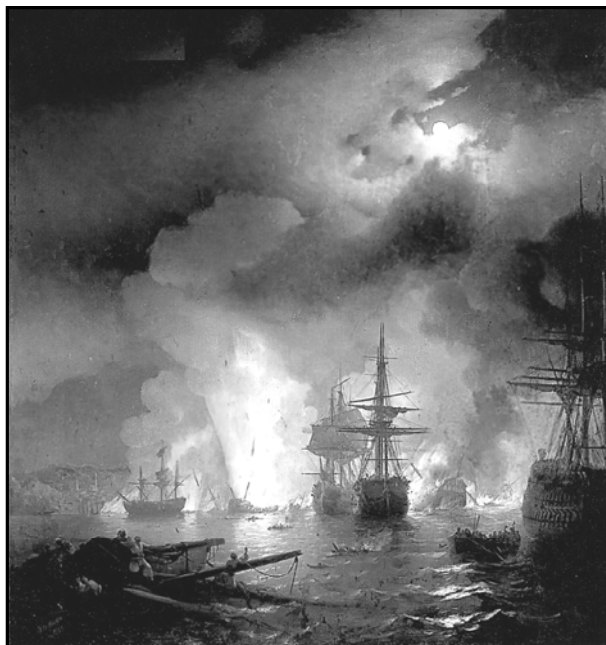
Рис. 4. Репродукція картини І.К. Айвазовського «Чесменський бій» (1848)

Приклад 5. Картина "Неаполітанська затока вранці" (1843).