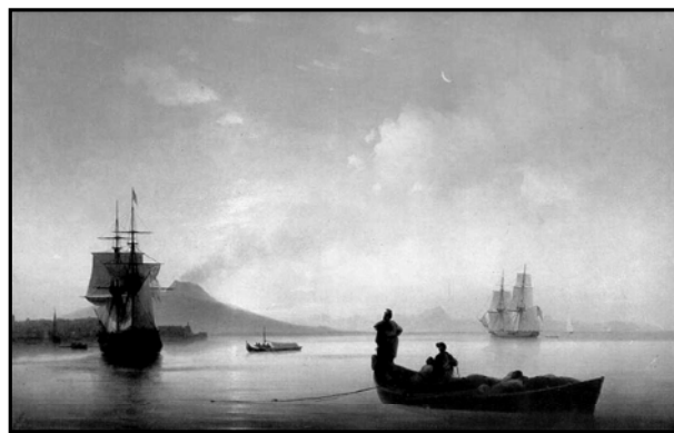
Рис. 5. Репродукція картини І.К. Айвазовського «Неаполітанська затока вранці» (1843)

Картина (рис. 6) являє собою вільну імпровізацію, подібну музичній, на тему місячної ночі. Найсвітліша пляма в небі – місяць. Потім легкий перехід від яскравого диска місяця до хмар,