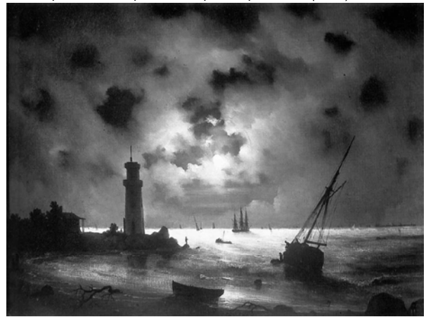
Рис. 1. Репродукція картини І.К. Айвазовського «Берег моря вночі» (1837)

Приклад 1. Картина “Берег моря вночі” (1837).