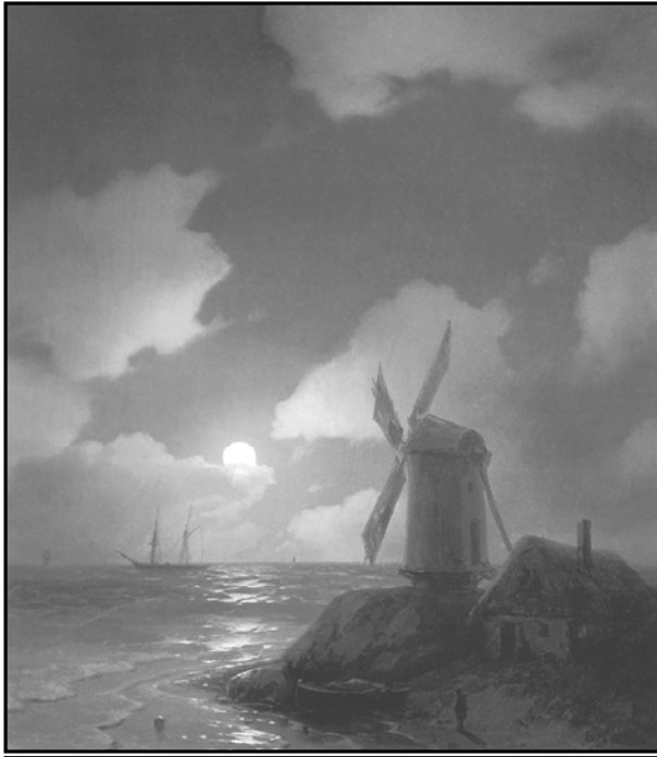
Рис. 6. Репродукція картини І.К. Айвазовського «Млин на березі моря» (1851)

Цікавим для учнів буде виконання завдання з проектування млина, для роботи якого будуть застосовані інші альтернативні джерела енергії.