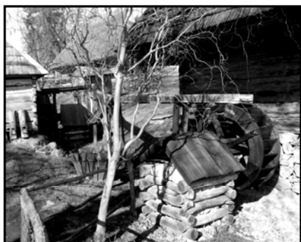
Рис. 5. Водяні млини

Учні мають пояснити, як відбувається перехід одного виду енергії у інший. Доречно поставити завдання зі складання якісної або кількісної фізичної задачі за спостережуваними явищами.