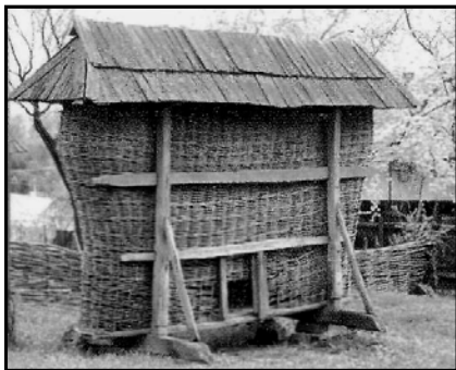
Рис. 8. Кіш для сушки сіна або зерна

Учні можуть пояснити фізичні явища, що використовуються селянами упродовж багатьох століть у таких «пристроях».