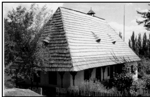
Рис. 1. Садиба з села Вишково

Після розповіді про хатину в учнів варто запитати: які закони фізики використовувались під час будівництва садиби. Учні мають відповісти на запитання стосовно теплообміну, конвекції, капілярних явищ та рівноприскореного руху.