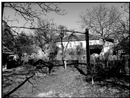
Рис. 3. Колодязь «журавель»

(важель), та дають відповідь на питання, чому одне плече набагато довше за інше.