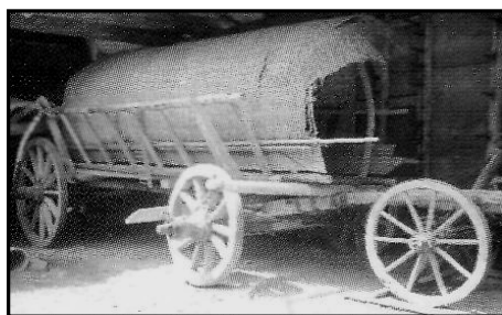
Рис. 6. Віз для перевезення «ропи»

Під час розглядання возу можна задавати питання, щодо радіуса коліс та висоти возу, ставити проблемні задачі стосовно доцільності саме такої конструкції возу для транспортування ропи, а не кам'яної солі.