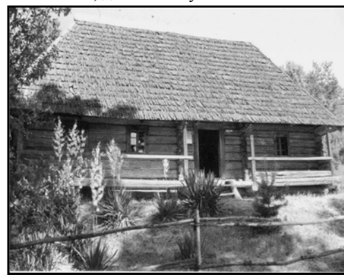
Рис. 2. Народна школа з села Синевирська Поляна

Серед, начебто, звичайних садиб можна побачити сільську школу того часу (див. рис. 2), яка зовні не відрізняється від житлової хати, але в середині містить дві хижки, сіни та комору. Вся будівля опалювалася металевою піччю, велика хижка – навчальний клас, а мала – кімната, де мешкав учитель.