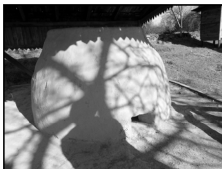
Рис. 7. Стара гончарна піч

Під час екскурсії учні мають пояснити за допомогою фізичних законів ті, явища, що відбуваються в печі для випалу виробів із глини.