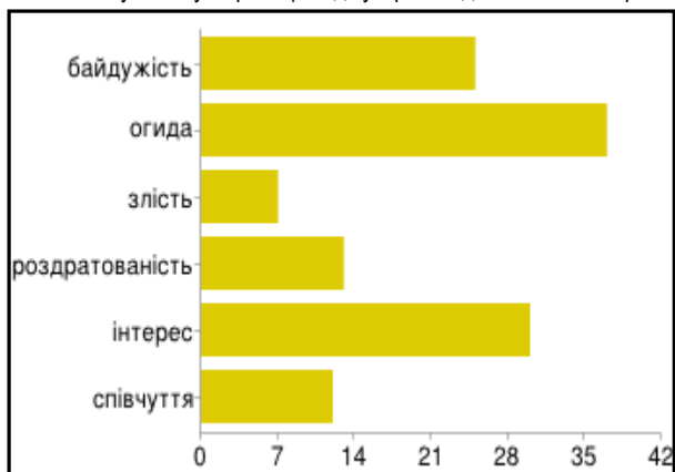
Діаграма 3 Яка у Вас була реакція від зустрічі з одностатєвою парою?

Позитивне ставлення до представників нетрадиційної орієнтації і одностатєвих пар пояснюють наступними причинами: