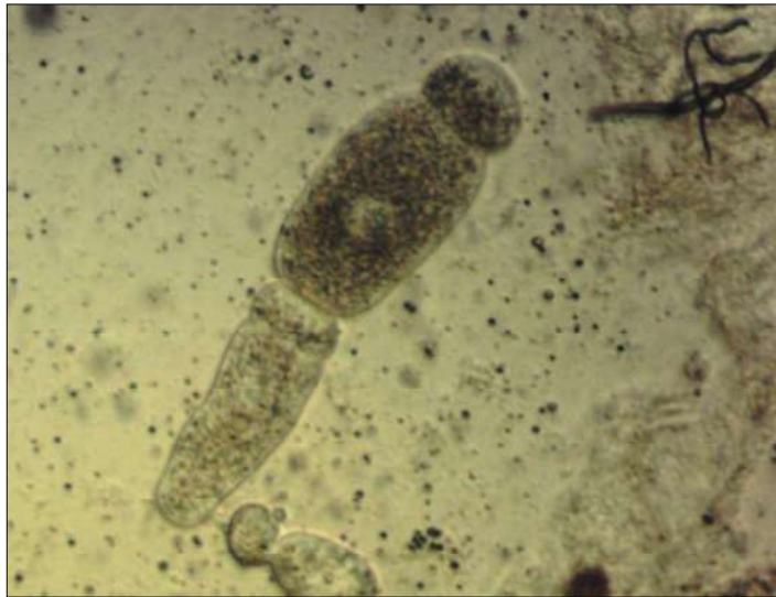
Рис. 1. Загальний вигляд трофозоїтів виду Gigaductus exiguus , виявлених у туруні C. melanocephalus . Шкала 10 мікрометрів

дослідження відібрано в період із травня до липня 2015 р., ручним розбором підстилки та опалого деревостану. Загальна кількість жуків C. Melanocephalus за площами складає 172 жуки (перша пробна ділянка – 19, друга – 47, третя – 32, четверта – 74 жуки відповідно). Кількість зібраного матеріалу відображає загальну картину зараження грегаринами C. Melanocephalus для Центрального регіону середньої частини степової зони України. За результатами лабораторного розтину жуків виявлено 172 грегарины в 33 жуках. Із порівняльного аналізу статевої вибіркості й кількісної оцінки зараження багато джерел наводять суперечливі доводи [17, 18]. За висновком багатьох дослідників, достовірність не спостерігали при такому розподілі паразитів усередині популяції хазяїна. У ході дослідження в аналіз не включено цей фактор і наведемо загальну характеристику видового різноманіття грегарины для регіону дослідження [24, 25, 26].