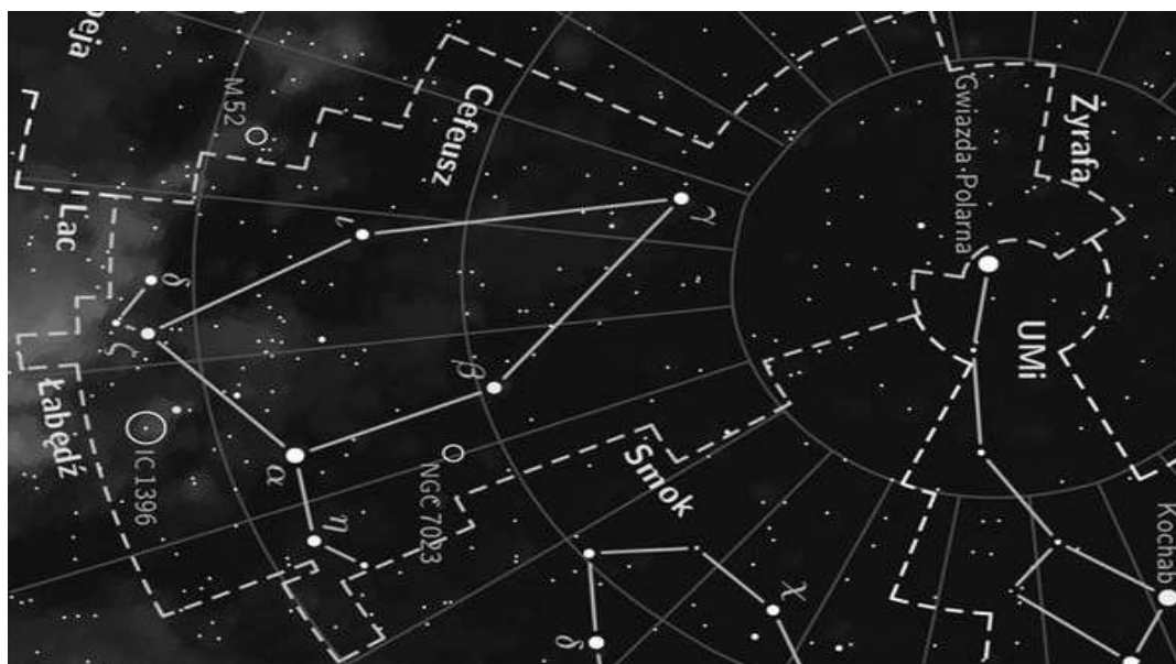
Рис. 1. Сузір'я Цефей

Для роботи ми обрали сузір'я Цефей (рис. 1), найбільш відповідне вимогам, що вказані вище. Сузір'я Цефей розташоване між Кассіопеєю та Малою Ведмедицею. \alpha Цефея розташоване на прямій, яка з'єднує \alpha та \beta Кассіопеї, на відстані, учетверо більшій, ніж відстань між цими зорями.