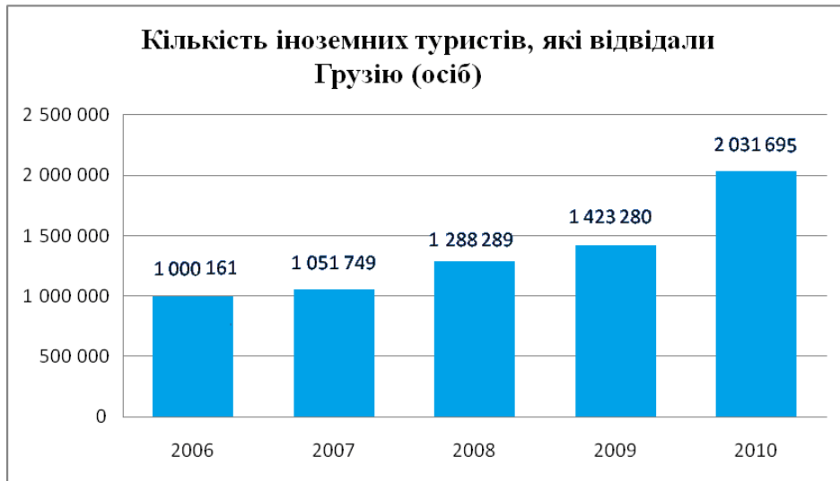
Рис. 1. Динаміка росту іноземних туристів у Грузії (2006–2010 рр.)

У контексті цього досить цікавим стало таке опитування. Для з'ясування враження від відвідування країни Департамент туризму і курортів Грузії 1–22 лютого і 4–15 травня 2010 р. в міжнародному аеропорту Тбілісі, на прикордонних пунктах у Садахло (на кордоні з Вірменією), Цітелі Хіді (на кордоні з Азербайджаном) і Сарпі (на кордоні з Туреччиною) провів опитування серед туристів, які залишають країну. У ньому взяло участь 1730 осіб, більшість із яких виявилися громадянами Німеччини, США, Великобританії й Франції. У результаті аналізу опитувань з'ясувалося, що 34 % опитаних приїхали до Грузії з діловою метою, близько 24 % відвідували своїх друзів і родичів, у 24 % приїзд був пов'язаний із відпочинком і розвагами, 8 % приїжджали за покупками, 4 % були транзитом. 30 % іноземних візитерів мали вік 35–44 років, 29 % – 25–34 роки, 21 % – 45–54 роки, по 9 % – 16–24 і 55–64 років, 2 % – понад 65 років. 81 % усіх, хто відвідав Грузію, були чоловіки. 46 % зупинялися в готелях та інших платних помешканнях великого обсягу, 37 % – у друзів або знайомих (безкоштовне житло). Середній час перебування в країні – 11,37 днів, у тому числі на відпочинок і розваги – 8,97 днів, на відвідування друзів та родичів – 13,58, ділові візити – 11,30. 61 % візитерів перебували в Грузії менше п'яти днів, а 6 % – більше 30 днів. Загальні витрати туристів різнилися залежно від мети відвідування країни [4].