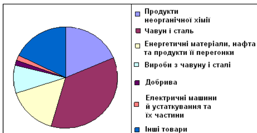
Рис. 2. Товарна структура експорту товарів з України до США у 2010 р.

У 2011 р. зовнішня торгівля товарами між двома країнами помітно активізувалася. Так, за дев'ять місяців 2011 р. товарооборот між Україною та США збільшився до 2,7 млрд дол. США, а за наступних два місяці ще більше зріс, досягнувши 3,35 млрд дол. За обсягами товарообороту США залишалися на восьмому місці серед країн-партнерів. За даними Держкомстату України, сальдо балансу двосторонньої торгівлі за дев'ять місяців 2011 р. зросло і становило -1110,8 млн дол. США. При цьому відбулося помітне зростання експорту українських товарів до США (на 30 % відносно дев'яти місяців 2010 р.). Загальний обсяг експорту на кінець вересня 2011 р. становив 803,4 млн дол., а до кінця листопада він досяг 998,8 млн дол. Водночас імпорт американських товарів в Україну також зріс (на 58,3 % порівняно із січнем–вереснем 2010 р.) і становив 1914 млн дол. США [4]. За даними Держкомстату України, загальний обсяг імпорту з України в США за 11 місяців 2011 р. досяг 2352,3 млн дол., що зумовило зростання від'ємного торговельного сальдо для України у торгівлі з США до -1353,5 млн дол. США. У загальному обсязі українського імпорту частка США збільшилася до 3,2 % і вони зайняли шосте місце серед країн-партнерів, які постачають свою продукцію в Україну.