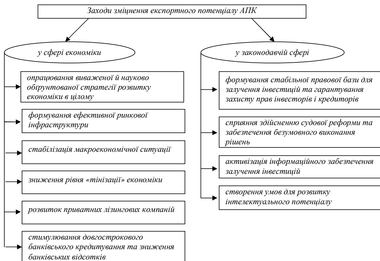
Рис. 2. Заходи зміцнення експортного потенціалу АПК (Складено за: [3, 88])

Висновки й перспективи подальших досліджень. Зовнішньоекономічна діяльність агропромислового комплексу України характеризується динамічним розвитком і сталою питомою вагою в загальних обсягах торгівлі. Зовнішньоторговельне сальдо сільськогосподарської продукцією позитивне. Під час удосконалення механізму державного регулювання експорту та імпорту сільськогосподарської продукції потрібно покращити інвестиційний клімат у цій сфері, врахувати роль державної підтримки на належному рівні правової, виконавчої, платіжної й податкової дисципліни. Державне регулювання зовнішньоекономічної діяльності АПК повинно сприяти зміцненню продовольчої безпеки країни, покращенню добробуту її населення, створенню сприятливих умов для зміцнення позицій України на світових ринках.