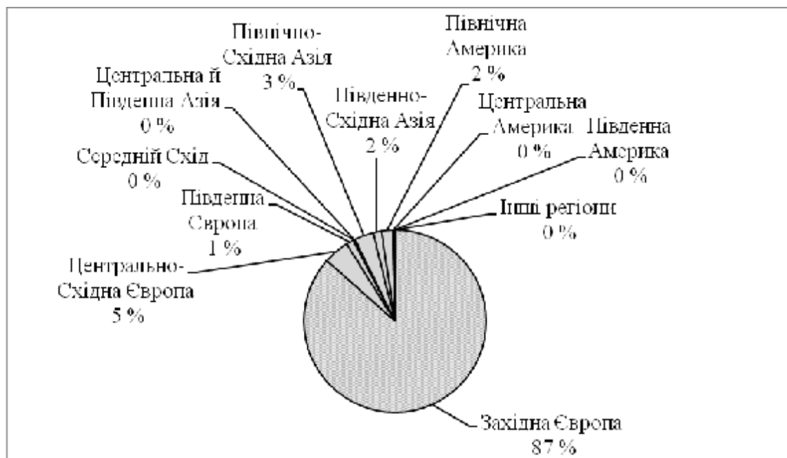
Рис. 3. Імпорт товарів Ліхтенштейну за регіонами світу (складено за даними: [8])

Щодо імпорту, то стратегічними партнерами Ліхтенштейну є країни Західної Європи (рис. 3). Серед них можна виділити ФРН (41 %), Австрію (35 %), дещо відстає Італія (4 %).