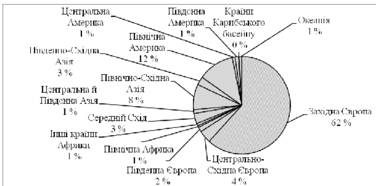
Рис. 2. Експорт товарів Ліхтенштейну за регіонами світу (складено за: [8])