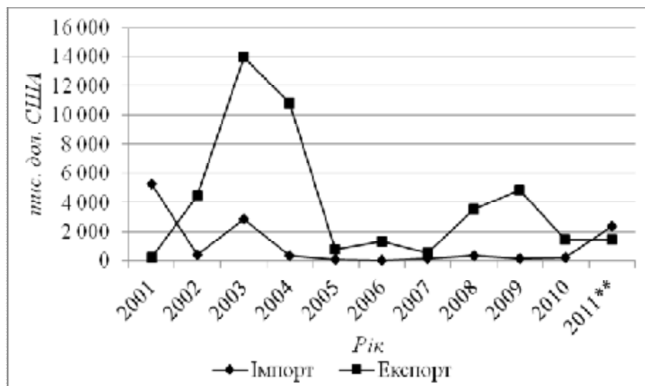
Рис. 4. Зовнішня торгівля товарами Ліхтенштейну з Україною (Складено за: [2], дані за січень–серпень 2011 рр.).

Одним із зовнішньоекономічних партнерів Ліхтенштейну є Україна, проте зовнішньоторговельний оборот між країнами тут незначний. Обсяги від торгівлі товарами між обома країнами вищі від аналогічного показника із торгівлі послугами. Аналізуючи рис. 4, можна відзначити домінування експорту Ліхтенштейну, причому найбільший сплеск відбувся у 2003 р.