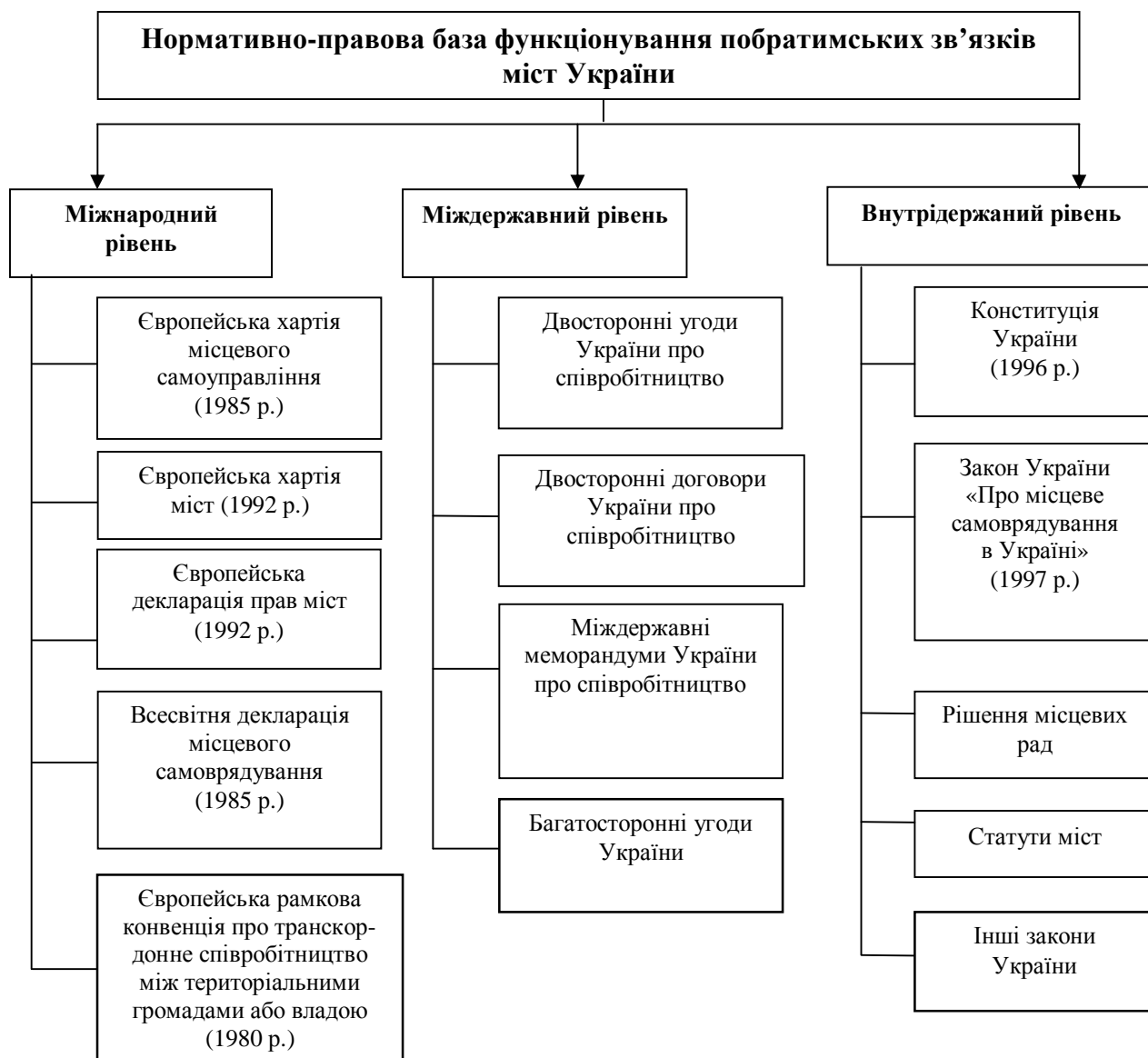
Рис. 1. Нормативно-правова база функціонування побратимських зв'язків міст України

Важливими документами, що лежать в основі правового обґрунтування партнерських (побратимських) зв'язків міст, є Європейська хартія міст та Європейська декларація прав міст , ухвалені в березні 1992 р. Європейська декларація прав міст проголошує право громадян міст на фінансові механізми і структури, які дають змогу місцевим органам влади (за певних умов спільно) знаходити фінансові ресурси, необхідні для здійснення прав, визначених цією декларацією. До таких прав віднесено право на безпеку, незабруднене і здорове навколишнє середовище, на працю, житло, свободу пересування, на охорону здоров'я, спорт і дозвілля, на культуру, розвиток економіки та навколишнього середовища, на міжміське співробітництво, на рівноправність. Відповідно, у разі порушення вищеподаних прав чи виникнення певних проблем і з метою їх швидкого та якісного вирішення міста об'єднуються, а в результаті формування дружніх і доброзичливих відносин мають хороше підґрунтя для встановлення побратимських зв'язків.