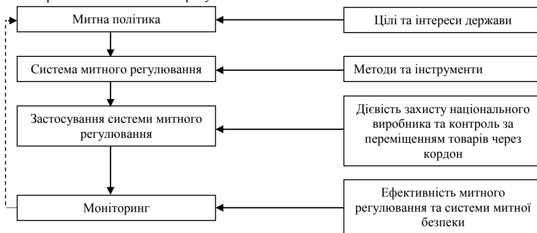
Рис. 2. Етапи та складові частини митної безпеки

Митна безпека включає в себе гарантування безпеки торговельного ланцюга постачання та безпеку, що забезпечується боротьбою з контрабандою і порушеннями митних правил й тісно пов'язана із зовнішньоторговельною безпекою, яка характеризує стан митних інтересів у сфері експорту та імпорту.