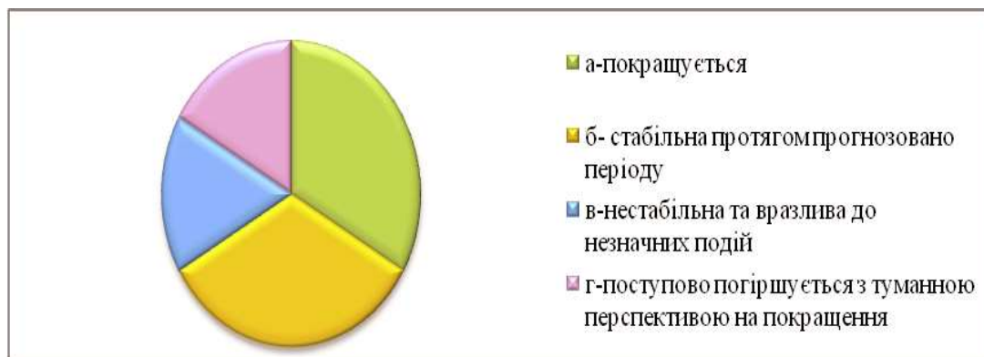
Рис. 1. Оцінка динаміки розвитку відносин України та США на 2013 р.

Для відстеження трансформацій моделі Україна – США за основу взято експертну модель двостороннього партнерства України та США, побудовану нами на основі результатів експертного опитування, у якому брали участь компетентні експерти. Мета опитування полягала у виявленні позицій експертної спільноти з приводу перспектив українсько-американського партнерства. Оцінивши динаміку розвитку відносин України й США, більшість експертів дотримувалися «оптимістичних» поглядів. Жоден з експертів не оцінив відносини України та США як ті, що швидко й безповоротно погіршуються (рис. 1).