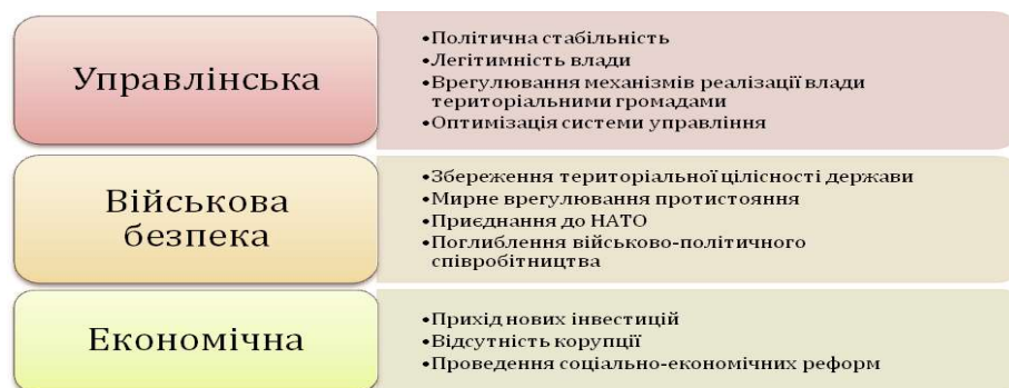
Рис. 2. Зміни, які повинні відбутися в Україні при реалізації найбільш реальної стратегії

Із досягненням найбільш реальної стратегії ситуація в Україні повинна змінитися в позитивний бік. За результатами експертного опитування ці зміни повинні були відбутися в декількох сферах (рис. 2).