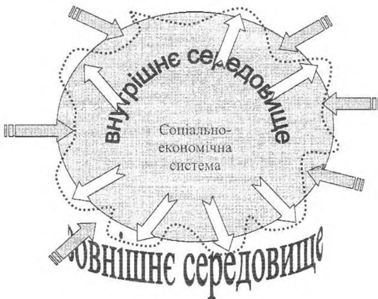
Рис. 1. Стан «відносної безпеки»

ж загрозою безпеці системи. Слід згадати й те, що безпека --- це не лише стан, але й дія, спрямована на захист системи та повернення її до рівноваги. Руйнування, зміна, відхилення від рівноваги — це небезпека. Звідси, якщо до уваги ще й взяти твердження російський фахівців І. Брокхауза та І. Ефрона, безпека досягається усуненням небезпеки, а стан «небезпека» та «безпека» характеризується різним рівнем небезпеки, то категорію «безпека» можна умовно поділити на «абсолютну» та «відносну». Якщо абсолютна — це стан рівноваги, якщо відносна — це стан, коли система перебуває під впливом різних факторів, які відхиляють її від рівноваги, але рівень небезпеки не є критичним для руйнації, що не ставить під сумнів виконання місії, досягнення цілей розвитку (рис. 1).