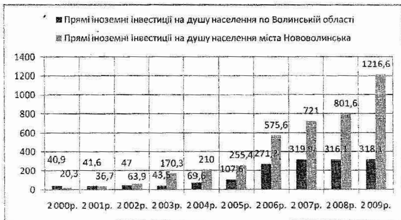
Рис. 2. Динаміка прямих іноземних інвестицій на одиницю населення по регіону упродовж 2000–2009 рр. (дол. США) [7]

Проведене дослідження дає можливість зробити висновок, що територія пріоритетного розвитку — це особлива модель розвитку економіки регіону, спроможна за рахунок преференційного режиму інвестиційної діяльності розв'язати проблеми структурної перебудови господарства, сприяє прискореному соціально-економічному розвитку територій, котрим у силу різних причин притаманна економічна відсталість або втрата попереднього потенціалу росту.