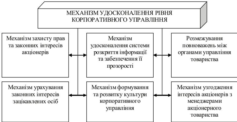
Рис. 4. Внутрішній механізм корпоративного управління в акціонерному товаристві

Сьогодні в Україні відбуваються перерозподіл власності, боротьба за концентрацію прав на контроль над фінансовими і товарними потоками підприємств, тобто концентрація власності в ході жорсткої боротьби за контроль із застосуванням різних механізмів й інструментів, а саме: використання інституту довірчого управління для державних пакетів акцій та інституту банкрутства; консолідація акцій різними способами в замкнених галузевих, регіональних, міжгалузевих і міжрегіональних групах; захоплення лідируючих позицій у раді директорів; емісія акцій; зміни структури груп акціонерів.