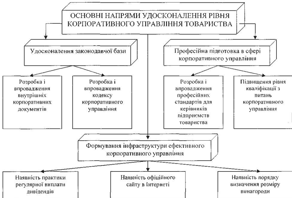
Рис. 3. Схема удосконалення рівня корпоративного управління

Конфігурація корпоративної власності, що складається нині в українській економіці, цілком вписується у вищезазначену загальну закономірність. Завершився початковий етап широкомасштабного розподілу власності, наслідком якого стало значне розпорошення прав власності. Тобто, сформувалася змішана, але з відчутними аутсайдерськими рисами система корпоративного управління, пов'язана з наявністю чималої кількості дрібних власників корпоративних цінних паперів [6].