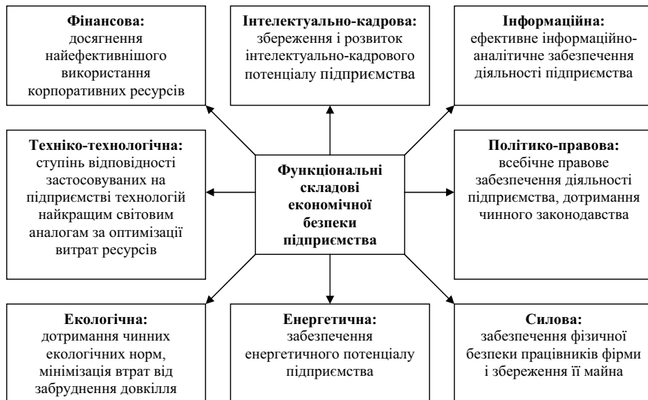
Рис. 2. Основні складові економічної безпеки підприємства

Автори виділяють різні складові економічної безпеки підприємства, зокрема, фінансову, інтелектуальну та кадрову, техніко-технологічну, політико-правову (юридичну), інформаційну, екологічну, силову (рис.2).