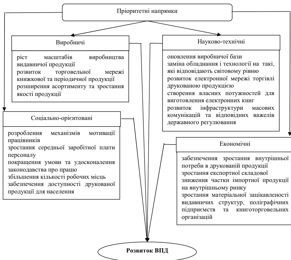
Рис. 1. Пріоритетні напрямки розвитку ВПД

Завдання державної політики кожної країни стосовно друкованої продукції полягає не тільки в тому, щоб сприяти випуску її в достатній кількості та раціонально організувати систему торгівлі, а й забезпечити правильне й оптимальне функціонування, аби вона могла вписатися в сучасну систему засобів масової комунікації. Продукція ВПД має вирішувати передусім завдання не економічної ефективності (давати прибуток, що є внутрішньою проблемою господарської одиниці), а соціально-економічні, для чого необхідне державне втручання шляхом розроблення відповідного організаційно-економічного механізму розвитку ВПД (рис. 1).