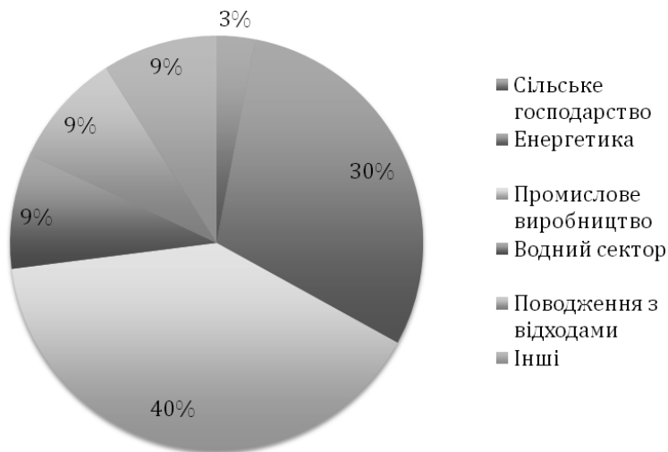
Рис. 2. Тематика проектів програми «Чисте виробництво» [2]

Ключовим завданням програми є підтримка екологічно і економічно ефективних проектів як позитивних прикладів передової практики, що відповідає принципам стійкого розвитку промислового виробництва та інших видів економічної діяльності. Основним критерієм оцінки проектів програми служить природоохоронний ефект, виражений зрозумілими кількісними показниками. Чисте виробництво потребує оновлення технологічних методів і устаткування. За програмою «Чисте виробництво» надає пільгові кредити як приватним, так і державним підприємствам. Графік погашення кредиту безпосередньо враховує ефективність інвестицій.