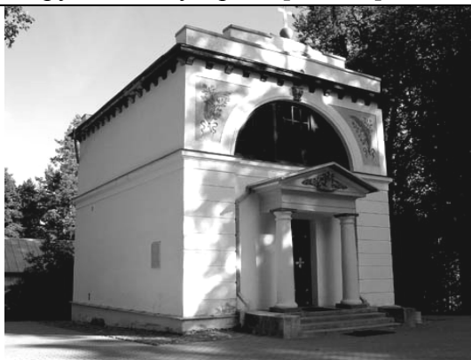
Іл. 3. Мавзолей генерал-фельдмаршала М. Б. Баркляя-де-Толлі в Йигевесті, Естонія. Сучасний вигляд [7].