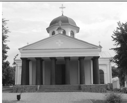
Іл. 2. Сучасний вигляд Хрестовоздвиженської церкви – усыпальниці Раєвських зі сторони головного входу.