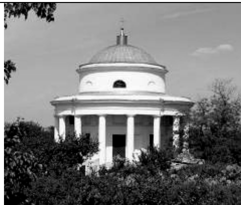
Іл. 6. Свято-Митрофанівська церква – усипальниця генерала І. М. Інзова у Болграді (Одещина). Сучасний вигляд [16].