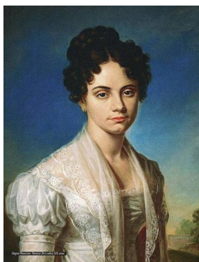
М.М. Волконська (Раєвська) (Невідомий художник, 1821 р.).