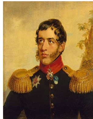
Генерал-майор С.Г. Волконський (Д. Доу, 1820 р.).