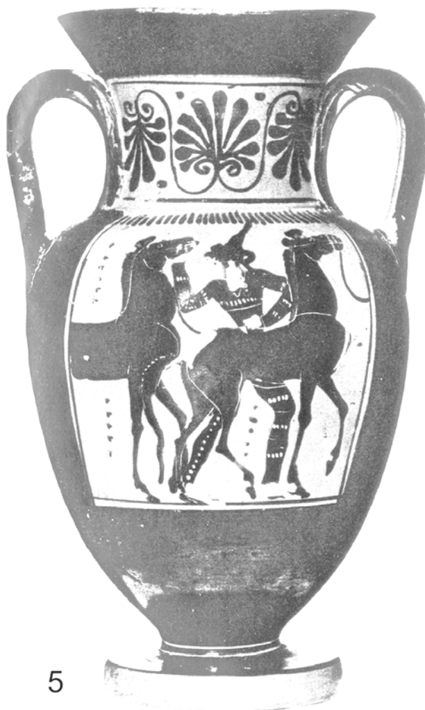
Рис. 2. Зображення вершниць на мозаїчному панно (1) і на керамічних розписних вазах (2–5).