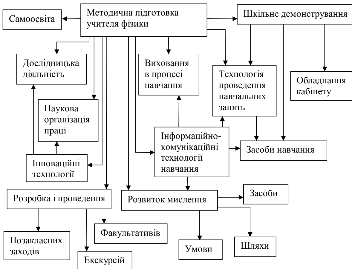
Рис. 1. Структура методичної підготовки учителя фізики

означає, що в даному змісті повинні бути подані всі основні елементи такої діяльності: спеціальні, психолого-педагогічні, конкретно-методичні знання, способи діяльності, бачення оточуючого світу і себе в ньому, досвід творчої діяльності тощо. Конкретний зміст кожного з цих елементів і їх співвідношення повинні постійно оновлюватись і переосмислюватись. Майбутній учитель працюватиме в умовах збільшення багатоваріантності організаційних форм, змістових структур й методичних систем навчання фізики.