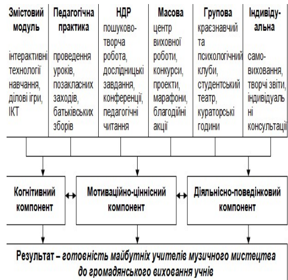
Мал. 1 Структурно-функціональна модель підготовки майбутніх учителів музичного мистецтва до громадянського виховання учнів

На мал. 1 схематично зображено структурно-функціональну модель підготовки майбутніх учителів музичного мистецтва до громадянського виховання учнів, яка передбачає врахування сучасних тенденцій реформування системи освіти України, а саме: суттєву зміну вимог до організації процесу професійної підготовки майбутніх педагогів до виховної діяльності, організацію навчально-виховного процесу з позицій особистісного, діяльнісного і компетентнісного підходів.