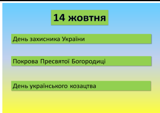
Рис. 4. Слайд 1 презентації «14 жовтня»

На рисунку 5 зображено розв'язання задачі 2.1 учнями 4-Б класу Бодрухівним М., Мараховським О.