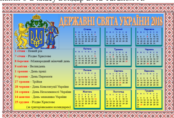
Рис. 2. Календар «Державні свята України» [7, 14]

На рисунку 2 зображено розв'язання задачі учнями 6-Б класу Бондар Б. та Таганом А.