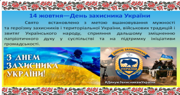
Рис. 5. Листівка «14 жовтня – День захисника України» [8, 9, 15, 16]

На рисунку 5 зображено розв'язання задачі 2.1 учнями 4-Б класу Бодрухівним М., Мараховським О.