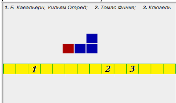
Рис. 2. Квест-игра к компоненту Архивы

каждый верный ответ ученик получает баллы. Цель игры: решить все исторические задачи, собрать как можно больше правильных квадратов. Принцип работы квеста основаны на игре «Змейка».