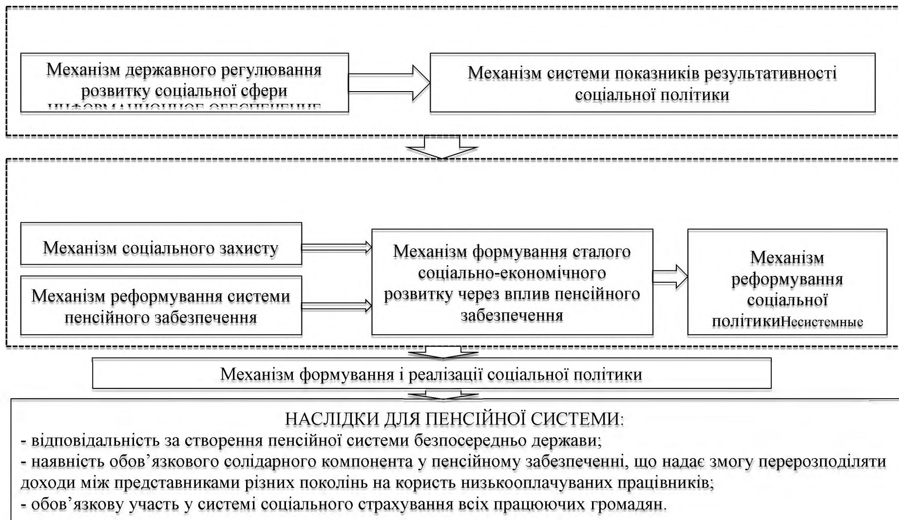
Рис. 3. Концепція формування і реалізації соціальної політики через призму реформування системи пенсійного забезпечення