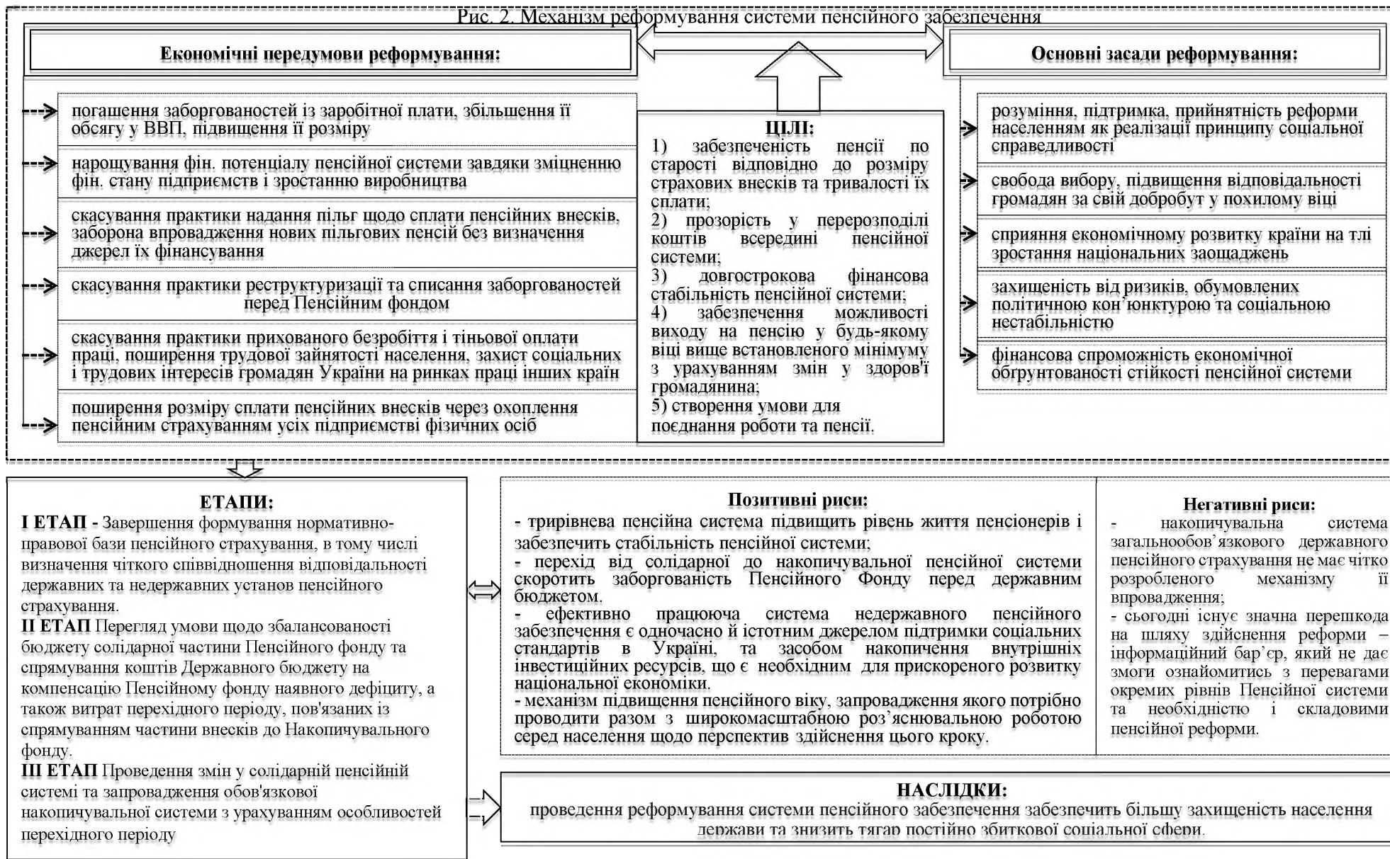
Рис. 2. Механізм реформування системи пенсійного забезпечення