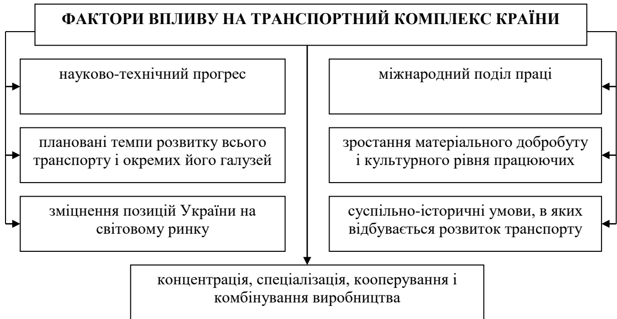
Рис. 1. Фактори впливу на транспортний комплекс країни

За роки незалежності транспортна галузь в Україні набула нових якісних стимулів для зростання. Вона забезпечує створення 13% валового внутрішнього продукту, а вартість основних засобів виробництва (за первинною оцінкою) складає 35% від загальної вартості виробничого потенціалу країни [6]. Транспортна система України представлена залізничним, автомобільним, морським, річковим, авіаційним, муніципальним і трубопровідним видами транспорту, дорожнім і шляховим господарством, кожен з яких має свою специфіку.