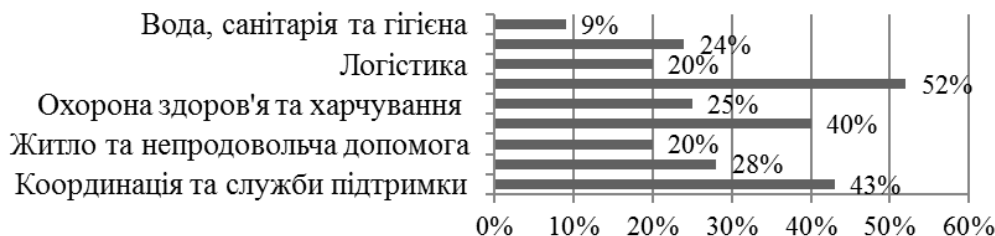
Рис. 2. Розподіл фінансування згідно кластерів ПГР у 2015 році, % [4]

На сьогодні 147 гуманітарних партнерів присутні в Україні, з яких 21 Міжнародна неурядова організація, 8 Агентства ООН, 7 Міжнародних організацій. Незважаючи на труднощі, що досі існують, гуманітарні партнери, які здійснюють свою діяльність у рамках ПГР, станом на кінець 2015 року, профінансували допомогу населенню України, що постраждали від воєнного конфлікту на Сході України та анексії АР Крим, у розмірі 183 млн дол. США (рис. 2).