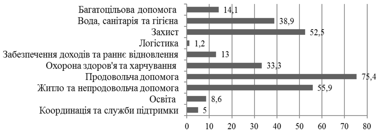
Рис. 4. Основні напрями надання Україні допомоги згідно ПГР на 2016 рік (за кластерами), мільйон дол. США

7 грудня 2015 року запущено Глобальний план гуманітарного реагування на 2016 рік, у даному плані є розрахунки фінансової та гуманітарної допомоги і Україні. Розподіл фінансування між кластерами у 2016 році продемонстровано на рисунку 4 [7].