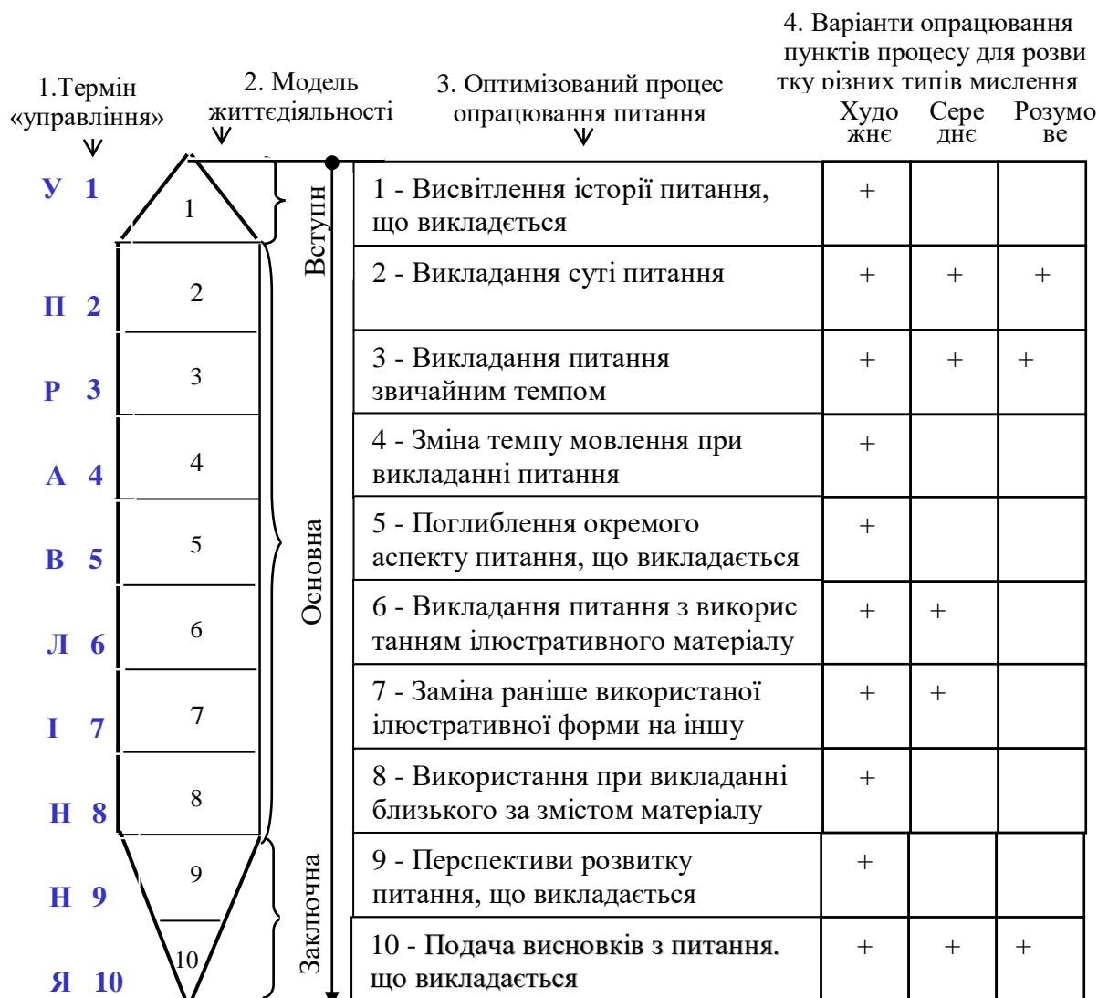
Рис. 2. Модель творчого самоуправління формуванням і розвитком трьох типів мислення: художнє – розумове – середнє.

Опрацювання запропонованої моделі творчого самоуправління передбачає відповіді на одне і те ж питання за різну кількість часу, що дозволяє управлінцю, в залежності від кількості відведеного на відповідь часу, використовувати різні методи викладання питання. За рахунок цього можна системно управляти розвитком атрибутивного мислення і розвивати його основні типи: художнє – розумове – середнє.