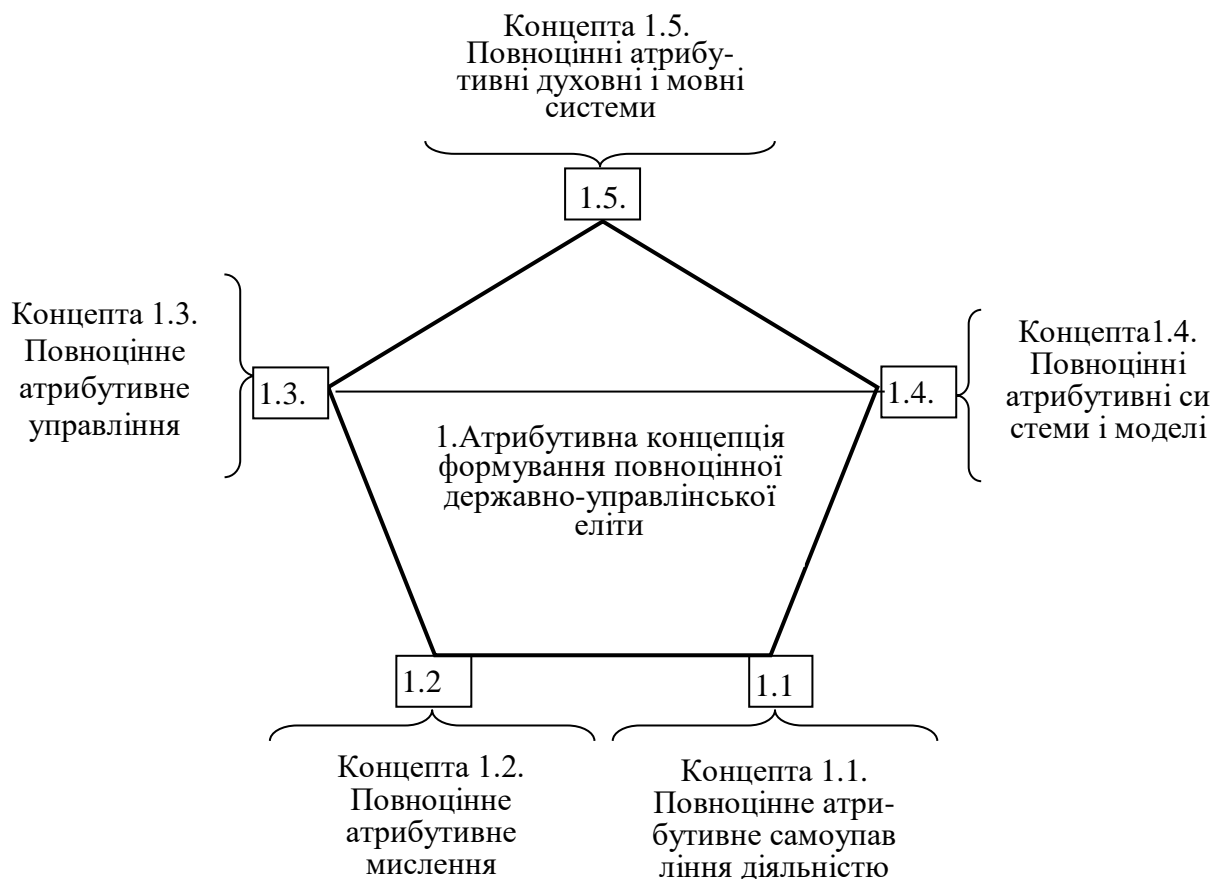
Рис. 1. Атрибутивна концепція формування повноцінної державно-управлінської еліти.

В результаті того, що в системі самоуправління суб'єктом і об'єктом одночасно виступає одна й та ж особа, воно є найбільш складним, з усіх існуючих видів управління, на що неодноразово вказували видатні мислителі минулого і сучасності. «Якщо б хто-небудь у битві тисячоразово переміг себе одного, то саме цей другий – найвеличніший переможець у битві» (Будда). «Не може керувати іншими той, хто не в змозі керувати самим собою» (Анг. прислів'я), «Найсильніший той, хто має владу над собою» (Сенека). Це зумовлює суттєві труднощі при формуванні повноцінної державно-управлінської еліти. Для надання допомоги при розв'язанні цієї проблеми професорсько-викладацьким колективом Донецького державного університету управління у 2009 році підготовлено навчально-методичний посібник Книга 1. Самоуправління навчанням Ч. 1. Анотований конспект лекцій, Донецьк 2009, 313 с. [12] і практичний посібник Книга 1. Самоуправління навчанням Ч. 2. Зміст практичних занять і методичні рекомендації до їх виконання. Донецьк 2009, 181 с. [13].